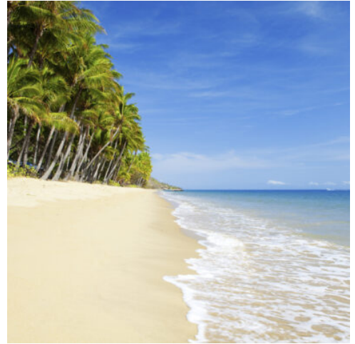
Deserted tropical beach with palm trees

Sie folgen dem Pacific Highway weiter und gelangen nach Port Macquarie. Dieses kleine Küstenörtchen lädt zum Entspannen ein. Genießen Sie doch heute nachmittag das Strandleben in vollen Zügen!