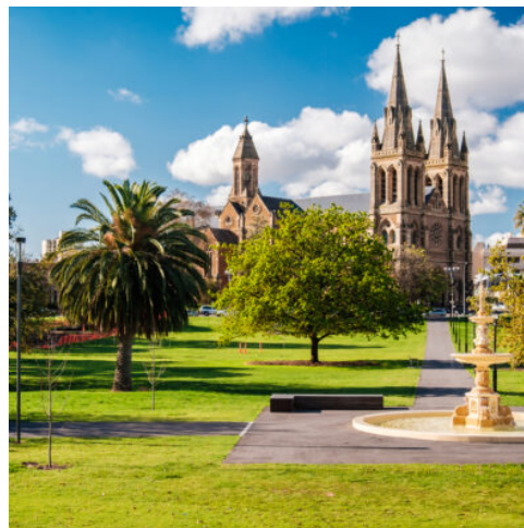
St. Peter's Cathedral in Adelaide

Weiterfahrt nach Mount Gambier. Die malerische Kleinstadt Mount Gambier ist in den Hängen eines erloschenen Vulkans gebaut, dessen Krater von einem malerischen See gefüllt ist. Vielleicht haben Sie Glück und erleben ein farbenfrohes Naturspektakel! Jedes Jahr im November verändert sich die Farbe des Blue Lake von einem blassen Grau in ein tiefes Blau.