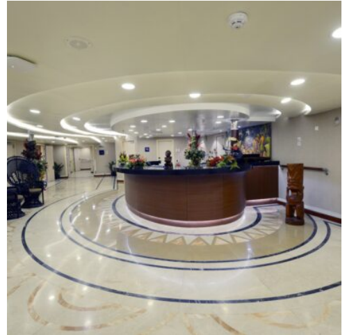
Aranui 5 - Rezeption

Fakarava ist das zweitgrößte Atoll in Französisch-Polynesien und wird von der UNESCO als Biosphärenreservat für die Erhaltung seltener Arten geschützt. Nach einem Buffet auf der Aranui geht es an der Anlegestelle von „Rotoava“ von Bord. Passagiere haben Zeit, das kleine Dorf zu erkunden, die aus Korallen erbaute Kirche zu besichtigen und das örtliche Kunsthandwerk kennenzulernen. Eine spannende Demonstration zeigt, wie vielfältig die Kokosnuss verwendet werden kann. Genießen Sie einen Tag voll Entspannung, Sonne und Strand. Schwimmen oder Schnorcheln Sie zwischen bunten tropischen Fischen. (F M A)