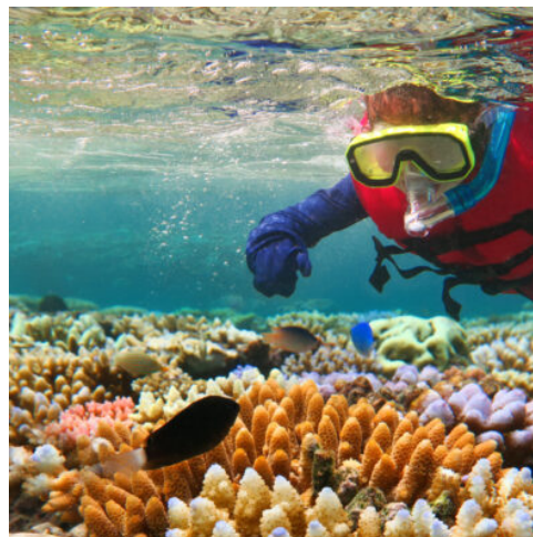
Great Barrier Reef

Im Daintree-Nationalpark begegnen Sie heute einem der ältesten Regenwälder der Welt und tauchen tief in die faszinierende Wildnis Australiens ein. Die Wanderung mit einem Guide des Aboriginal-Stammes der Kuku Yalanji führt durch die Mossman Gorge und vermittelt viel Wissenswertes über die Flora und Fauna. Entdecken Sie kristallklares Wasser, fantastische Kaskaden und imposante Granitfelsen. Mit etwas Glück werden Ihnen bei einer Bootsfahrt auf dem Daintree River die beeindruckenden Salzwasserkrokodile begegnen. (F)