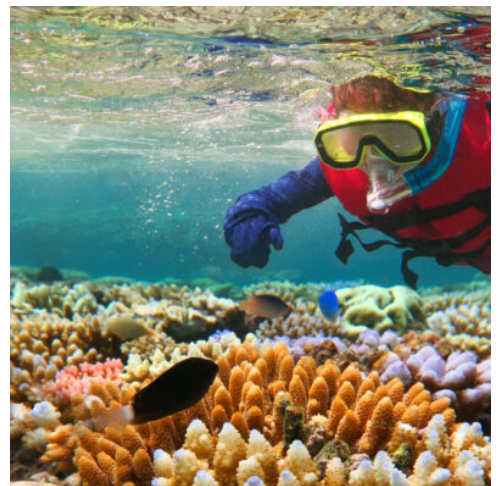
Great Barrier Reef

Heute verlassen Sie Daydream Island. Zurück auf dem Festland erwarten Sie ausgedehnte Zuckerrohrfelder auf der Fahrt nach Norden. Zwischendurch macht das Billabong Sanctuary Sie vertraut mit der endemischen Tierwelt Australiens. Seien Sie gefasst auf eine Tierbegegnung der besonderen Art. Tagesziel ist Townsville, die größte Stadt im nördlichen Queensland. (F A)