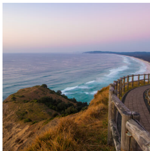
Gold Coast - Byron Bay

Entdecken Sie heute die schönsten Höhepunkte der multikulturellen Metropole am Meer. Am Mrs Macquarie's Chair im Botanischen Garten bekommen Sie eine wunderbare Aussicht auf das Opera House und auf die Harbour Bridge. Die bekannten Wahrzeichen der Stadt bieten tolle Fotomotive. Am berühmten Bondi Beach erleben Sie die strandgesäumte Seite Sydneys und können den Surfern beim akrobatischen Wellenreiten zuschauen. Mit einem Schiff geht es anschließend zu einer ausgiebigen Rundfahrt durch den riesigen Naturhafen. Den restlichen Tag können Sie die Stadt in Ihrem eigenen Tempo erkunden. Das Viertel The Rocks ist ein beliebtes Ausflugsziel. Zahlreiche Cafés, Bars und Galerien laden zum Verweilen ein. (F M)