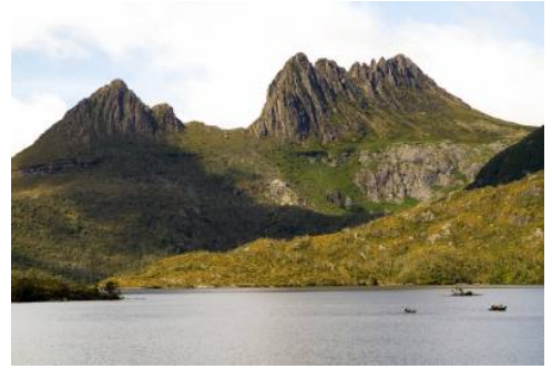
Cradle Mountain, Tasmania

In die rauen Anfänge des australischen Kontinents tauchen Sie heute im historischen Port Arthur ein. Der Ort, der bis zur Mitte des 19. Jahrhunderts als ausbruchssicheres Gefängnis galt, erwartet Sie während Ihrer Führung mit über 30 historischen Gebäuden, darunter Ruinen, aber auch restaurierte Häuser. Hier finden Sie Werke, die einst in Zwangsarbeit erschaffen wurden und laufen an und in ehemaligen Räumlichkeiten – von Bibliotheken, über Schlafräumen bis hin zu Wäschereien und Backstuben. Ihr Mittagessen genießen Sie ganz ohne finstere Gefängnisgeschichten auf einer schön gelegenen Lavendelfarm.