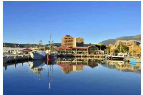
Hobart Marina In Morning

Rund 4 Millionen Einwohner zählt die Metropole Sydney, die Sie am heutigen Tag erkunden werden. Vor allem bekannt: der Naturhafen mit der Hafenbrücke und das berühmte Sydney Opera House. Beides können Sie auf dem Weg in den Botanischen Garten aus einer tollen Perspektive bestaunen. Vom „Mrs Macquarie's Chair“, eine in den Felsen gehauene Sitzbank, einst für Elizabeth Macquarie errichtet, haben Sie einen herrlichen Ausblick auf die Wahrzeichen Sydneys. Am Mittag erleben Sie Sydneys Naturhafen von einem Boot aus. Genießen Sie ein Lunch während Ihrer Rundfahrt. Von der Watsons Bay können Sie die Steilküste am Hafeneingang, kurz „The Gap“ bestaunen. Aber auch die Einkaufsstraße Oxford Street ist einen Bummel wert. Sie erreichen den Bondi Beach, der Kultstrand, der nicht nur Surfer aus aller Welt anzieht. Hier können Sie am Nachmittag am Strand oder in den nahegelegenen Parks spazieren und sich in den beliebten Cafés und Bars auf der Campbell Parade stärken.