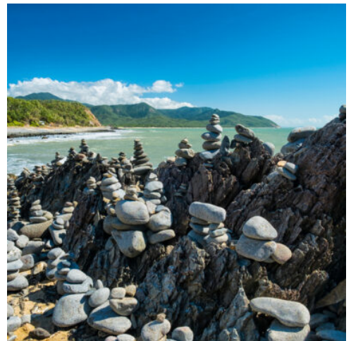
Balancing Rocks Of North Queensland

Bei einer Rundfahrt sehen Sie die Höhepunkte der Stadt: die Oper, die Hafenbrücke, den Botanischen Garten sowie die südlichen Strände. Eine Hafenrundfahrt am Mittag inklusive Lunch an Bord runden das Sightseeing an diesem Tag ab. Am Nachmittag haben Sie Zeit für eigene Erkundungen in der 4 -Millionen-Metropole. (F M)