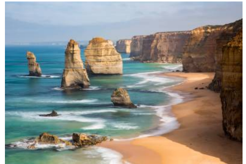
Great Ocean Road

Auch der heutige Tag wartet mit unvergesslichen Panoramen auf, denn die heutige Reiseetappe führt Sie auf die berühmte Panoramastraße Great Ocean Road. Malerische Buchten und bizarre Felsformationen, weite Felder, steile Klippen und das dunkle Blau des Ozeans erschaffen eine traumhafte Kulisse. Kleine Fischerdörfer und einsame Strände begleiten Sie auf dieser Fahrt, die Ihnen sicher noch lange im Gedächtnis bleiben wird. (F)