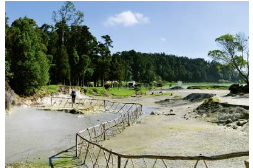
Lagoa Das Furnas

Begeben Sie sich auf die Spuren des Vulkanismus, der einst die Inseln formte und die paradiesische Flora und Fauna Sao Miguels prägte. Auf dem Weg durch die idyllisch grünen Hügellandschaften machen Sie in Vila Franca Halt, im 15. Jahrhundert die erste Hauptstadt der Insel, die einen faszinierenden Einblick in die Vergangenheit gewährt. Das Vale das Furnas begrüßt Sie anschließend mit tropischer Vegetation und den Kratern inaktiver Vulkane. Heiße Quellen und Geysire prägen das Tal, Rauchschwaden gleiten über die Erde und erschaffen eine einzigartige Atmosphäre. Am Ufer des Kratersees Lagoa das Furnas erwartet Sie mit der lokalen Spezialität „Cozido das Furnas“ ein Einblick in die lokale Kulinarik. Anschließend präsentiert sich Ihnen mit dem Botanischen Garten einer der schönsten Gärten Sao Miguels, der mit seinen natürlich warmen Wasserbecken zum Schwimmen einlädt. Entlang der malerischen Nordküste gelangen Sie zu einer Teeplantage, ehe Sie beim Aussichtspunkt Santa Iria die herrliche Aussicht über die Nordküste der Insel genießen. (F M)