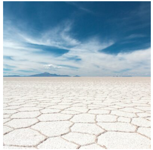
Salar de Uyuni

Nach dem Frühstück brechen Sie auf zu einem der absoluten Höhepunkte der Reise: dem Salar de Uyuni, der mit rund 10.000 km 2 als größte Salzwüste der Welt gilt. Die scheinbar endlose, weiße Fläche erinnert an eine riesige Eisbahn und sorgt für ein unvergessliches Erlebnis. Sie durchqueren die faszinierende Landschaft bis zur Insel Incahuasi, einem kleinen, felsigen Eiland mitten im Salzmeer, auf dem meterhohe Kakteen wachsen. Von hier aus genießen Sie einen spektakulären Rundumblick auf das schimmernde Salzfeld. Zum Mittagessen erwartet Sie ein besonderes Highlight: Ein Picknick mitten im Salar, liebevoll vor Ort für Sie arrangiert – ein einmaliges Erlebnis in außergewöhnlicher Kulisse. Am Nachmittag Rückkehr nach Uyuni. (F M)