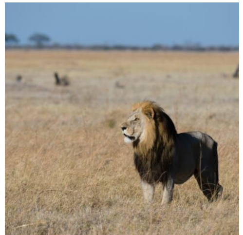
Löwe im Savuti-Gebiet

Heute erwartet Sie ein aufregendes Abenteuer im Moremi Wildreservat, einem der renommiertesten und tierreichsten Gebiete im Okavango Delta. Auf einer ganztägigen Pirschfahrt im offenen Geländewagen tauchen Sie tief in die afrikanische Wildnis ein und haben die Chance auf fantastische Tierbeobachtungen und unvergessliche Erlebnisse. Früher war das Moremi Wildreservat das reichste Jagdgebiet des Batswana-Stammes, bevor es zum Schutzgebiet erklärt wurde und heute als eines der besten Gebiete für Wildtierbeobachtungen gilt. Während der Pirschfahrt erkunden Sie die vielfältige Flora und Fauna des Parks: Elefanten, die majestätisch durch die Wälder ziehen, Flusspferde und Büffel, die sich in den Gewässern tummeln, sowie Löwen, die die weite Savanne durchstreifen. Mit etwas Glück begegnen Sie auf der Safari auch seltenen Raubtieren bei der Jagd oder entdecken andere faszinierende Tiere, die in dieser unberührten Wildnis ihren Lebensraum finden. (F M A)