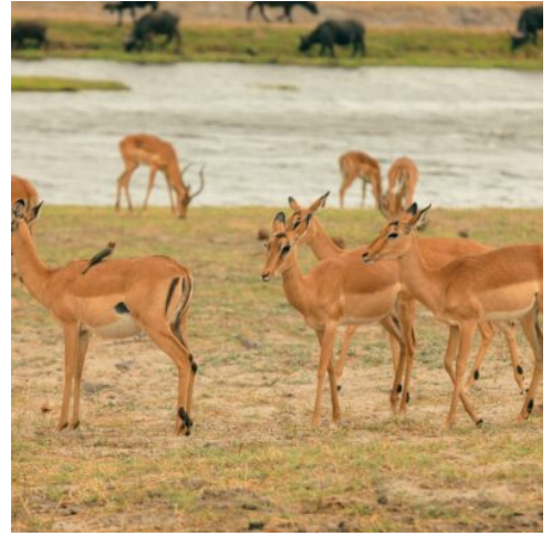
Antilopen im Moremi Wildreservat

Erleben Sie heute das Okavango Delta auf eine ganz besondere Art und Weise: mit einer Fahrt im Mokoro, einem traditionellen Einbaum, der sanft die schilfgesäumten Kanäle des Deltas durchzieht. Lehnen Sie sich zurück und genießen Sie die absolute Ruhe, während das Wasser sanft unter dem Mokoro plätschert. Ihr erfahrener „Poler“ (Steuermann) lenkt das Boot mit Präzision und Wissen durch das Delta und macht Sie auf die faszinierende Fauna und Flora aufmerksam. Nach dieser ruhigen und eindrucksvollen Erfahrung kehren Sie zum Mittagessen in Ihre Lodge zurück, wo Sie sich bei einem erfrischenden Drink entspannen können. Am Nachmittag haben Sie die Wahl, Ihre Safari mit einer aufregenden Pirschfahrt im offenen Geländewagen fortzusetzen oder das Delta aus einer anderen Perspektive bei einer Bootssafari zu erleben. Den Tag lassen Sie mit einem traditionellen „Sundowner“ ausklingen. Einem erfrischenden Drink inmitten der Wildnis, während die Sonne langsam über den Horizont sinkt und der afrikanische Abend einsetzt. (F M A)