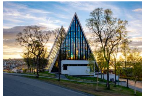
The Arctic Cathedral - Tromsø

Nach dem Frühstück erkunden Sie die Eismeerstadt auf einer Stadtrundfahrt. Ein Highlight ist der Besuch der Eismeer Kathedrale. Wie ein riesiger Eisberg erstreckt sie sich spitz gen Himmel. Sie wurde 1965 erbaut und ist von der arktischen Natur inspiriert. Ihre imposante Architektur hat sie zu einer besonderen Sehenswürdigkeit von Tromsø gemacht. Das Glasmosaikfenster „Wiederkunft Christi“ dominiert den Innenraum. Es ist eines der bekanntesten Werke des Künstlers Victor Sparre. Im Anschluss besuchen Sie das Erlebniszentrum „Polaria“. Schwerpunkt dieses Erlebnis- und Informationszentrums bilden Ausstellungen, die sich mit der Polarforschung befassen. In Aquarien sind Meeressäuger wie die Bartrobbe und verschiedene Fischarten der Barentsregion zu sehen. Das Erlebniszentrum befindet sich in einem unverwechselbaren Gebäude, das Eisblöcke darstellt, die vom rauen Ozean in der Arktis an Land geschoben werden. Am Nachmittag begeben Sie sich zu einer ca. dreistündigen Bootsfahrt nach Harstad und genießen die herrliche Küstenlandschaft aus einer anderen Perspektive. (F A)