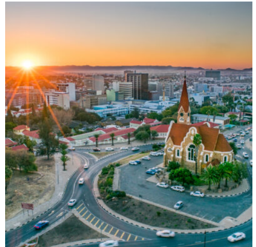
Christuskirche in Windhoek, Namibia

Heute landen Sie die namibische Hauptstadt Windhoek, die als politisches wie auch als kulturelles und wirtschaftliches Zentrum des Landes mit zahlreichen Sehenswürdigkeiten aufwartet. Entdecken Sie bei einer Stadtrundfahrt die Highlights der Stadt. Museen und Galerien prägen die Straßen, die romantische Christus-Kirche und der imposante Tintenpalast werden Sie begeistern. Nach diesen urbanen Impressionen setzen Sie Ihre Reise durch die atemberaubende Hügellandschaft zu den weiten Savannen der Kalahari fort. Tiefrot erscheint der Sand, durchbrochen von Dornensträuchern und Wüstengräsern, und erschafft einzigartige Panoramen, die den perfekten Auftakt für Ihre Reise zu den Höhepunkten Namibias bilden. (F A)