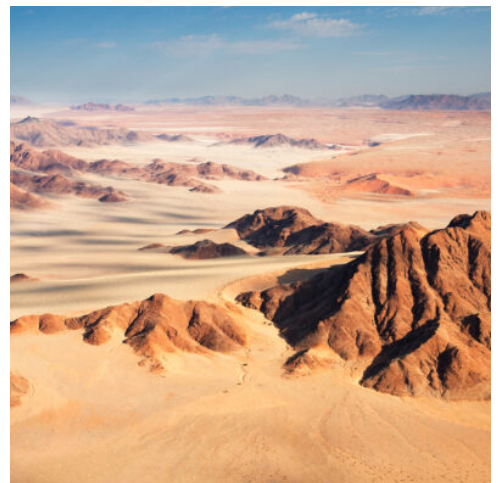
Namib Wüste, Namibia

Im Schein der Morgendämmerung lockt das erste Erlebnis des Tages. Im Namib Naukluft Park erheben sich gewaltige Dünen in bis zu 300 m Höhe, ein einzigartiger Anblick, der die Fahrt durch die Wüste zu einem unvergesslichen Erlebnis macht. Mit einem Allradfahrzeug gelangen Sie noch tiefer in die ursprüngliche Wüstenwelt, tief hinein in die unwirtliche Salztzopfanne des Sossusvlei. Tiefe Ruhe erfüllt die karge Landschaft, aus der sich rot die höchsten Dünen der Welt erheben. Nicht weit von hier erwartet Sie der Sesriem Canyon, eine dreißig Meter tiefe Schlucht, deren gewaltige Felswände nur ein schmaler Gang trennt, durch den einst ein Fluss führte. Lassen Sie sich auf dem Rückweg zur Lodge noch einmal von den faszinierenden Panoramen der Namib verzaubern. (F A)