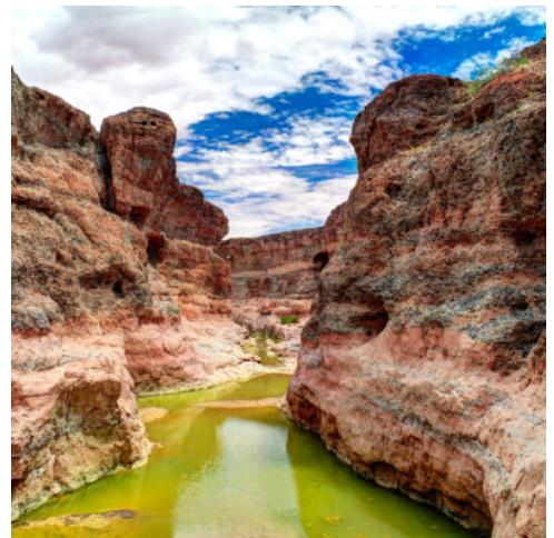
Sesriem Canyon, Namibia

Zahlreiche Abenteuer locken heute zu neuen Entdeckungen. Beginnen Sie Ihren Tag mit einem Besuch von Twyfelfontein. Über 2.500 Felsgravuren und Malereien zeichnen die roten Felsen, die sich in faszinierenden Formationen aus dem Tal erheben. Seine enorme historische Bedeutung machte diesen Ort zu einem der wichtigsten Kulturzentren der Welt, der 2007 in die Liste der UNESCO-Weltkulturerbes aufgenommen wurde. In einem traditionellen Dorf eröffnet sich Ihnen anschließend ein faszinierender Einblick in die Kultur der Damara. Ein weiteres Highlight der Region bildet der Versteinerte Wald. 260 Millionen Jahre reicht die Geschichte der Baumstämme zurück, die unberührt von Sand und Wind bis heute ihre ursprüngliche Form beibehalten haben. Streifen Sie zwischen den unbeugsamen Stämmen hindurch und entdecken Sie zwischen den Bäumen die Welwitschia, die älteste Wüstenpflanze der Welt. (F A)