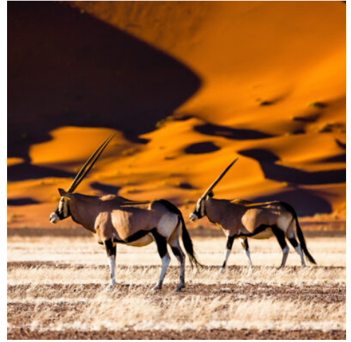
Dünen von Sossusvlei, Namibia

Wasserbegeisterten sei eine ruhige Katamaran-Fahrt entlang der malerischen Küste bis in die Lagune von Walvis Bay empfohlen, vorbei am Pelican Point, wo sich zahlreiche Robben tummeln und die Sonne genießen. (F)