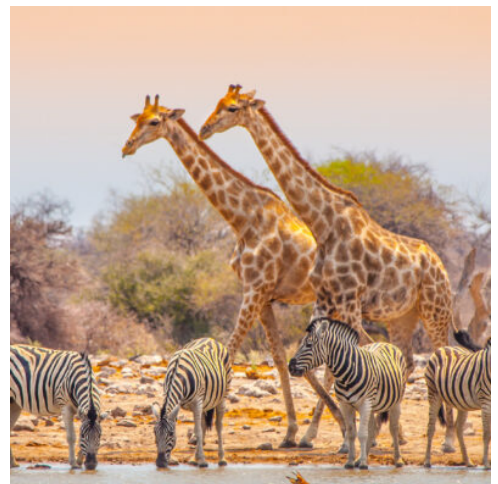
Etosha Nationalpark, Namibia

Heute heißt es Abschied nehmen von Ihrem Abenteuer in Namibia. Sie werden zum Flughafen Windhoek gefahren und treten Ihren Rückflug nach Deutschland an.