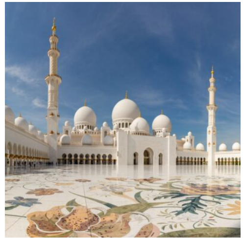
Sheikh Zayed Moschee

auf die atemberaubende Skyline von Abu Dhabi. Das Emirates Palace Hotel gehört zweifelsohne zu den Wahrzeichen, für die Abu Dhabi auf der ganzen Welt bekannt ist. Bestaunen Sie die pompöse Architektur und genießen OPTIONAL die High Tea Zeremonie, auch Nachmittagstee genannt (Aufpreis ab € 75,- p.P.). Sie nehmen Platz in einer gemütlichen Café-Lounge und genießen Sie frisch gebrühtem Kaffee oder Tee, ergänzt eine Auswahl an süßen und herzhaften Köstlichkeiten. Dann geht es weiter zur prächtigen Sheikh Zayed Moschee, ein architektonisches Meisterwerk mit arabischen Elementen und einer der größten Moscheen weltweit: die Sheikh Zayed Moschee. Dieses historisch bedeutende Gebäude vermischt verschiedene architektonische Stile und verkörpert die Botschaft der Toleranz und des Friedens im Islam. Rückfahrt nach Dubai und Abendessen im Hotel (F (P) A)