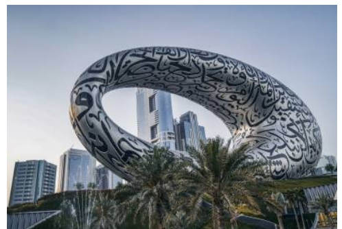
Museum of the Future

Frühstück und Freizeit. Beim heutigen Ausflug werden Sie am frühen Nachmittag mit Geländefahrzeugen (englischsprachige Fahrer ohne Reiseleitung- 6 Personen pro 4x4) zu einer aufregenden Wüstensafari gebracht. Im Herzen der Wüste, auf dem Weg zum Camp, wird Ihr Fahrer beim "Dune bashing" seine Erfahrungen bei der Durchquerung der goldenen Dünen demonstrieren. Anschließend geht es zum Beduinencamp, um Ihr BBQ- Abendessen zu genießen, währenddessen Sie einen Bauchtanz Show bewundern können. Ihr Fahrer begleitet Sie anschließend zurück zum Hotel. (F)