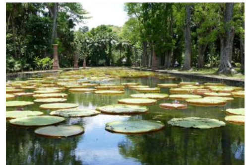
Botanischer Garten Pamplemousse

Nach dem Frühstück machen Sie sich auf den Weg in den Südwesten. Zuerst steht der Besuch des ruhenden Vulkans Trou aux Cerfs auf dem Programm, der von einem üppigen grünen Wald umgeben ist. Weiter führt die Tour zum Grand Bassin-See und dessen Tempel, bekannt als heiliger Ort für Hindus. Weiter geht die Fahrt zum Black River Gorges Nationalpark. Sie finden hier mehr als 300 Pflanzenarten und neun Vogelarten, die es nur auf Mauritius gibt. Bei einem Fotostopp genießen Sie spektakulärste Ausblicke auf grüne Täler, grandiose Wasserfälle und dichte Regenwälder. Danach erleben Sie eine Führung durch die Rumdestillerie La Rhumerie de Chamarel, Rumverkostung inklusive. Zum Abschluss bewundern Sie den ca. 90 m hohen Wasserfall von Chamarel und die „Siebenfarbige Erde“, Sanddünen die in 7 verschiedenen Farben schimmern. (F M A)