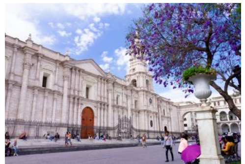
Plaza de Armas in Arequipa

Heute entdecken Sie die weiße Stadt Arequipa. Ihren Beinamen verdankt sie ihren Gebäuden aus hellem Vulkangestein, die die gesamte Stadt in strahlendes Weiß tauchen. Lassen Sie sich bei einer Stadtführung durch die schmalen Gassen vom einzigartigen Charme Arequipas verzaubern. Die Architektur ist geprägt von der Baukunst der spanischen Kolonialzeit, in dem sich verschiedenste Stile seit dem europäischen Barock vereinen. Im Kloster Santa Catalina erwartet Sie der wohl geheimnisvollste Teil der Stadt. Hohe Mauern umgeben das Viertel und schützten den Klosterbezirk und seine adeligen Bewohnerinnen jahrhundertlang vor den Wirren der Stadt, denn bis in die 1970er Jahre hinein entsagten die Nonnen gänzlich dem Kontakt zur Außenwelt. Ihr nächstes Ziel führt Sie ein Stückchen aus der Stadt hinaus zum Aussichtspunkt Yanahuara, von wo sich Ihnen ein atemberaubender Blick über die von Vulkanen umgebene Stadt bietet. Gestalten Sie den Rest des Tages frei nach Ihren Vorlieben. Streifen Sie durch die schmalen Gässchen, schlendern Sie über traditionelle Märkte und den malerischen Plaza de Armas und besuchen Sie die berühmte Kathedrale, die als die schönste des Landes gilt. (F)