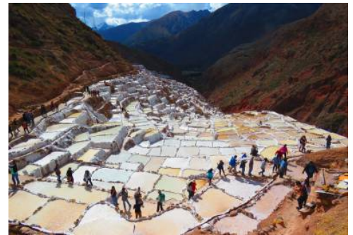
Salzterrassen von Maras

Die einstige Inkahauptstadt, auf einer Höhe von 3.400 m gelegen, fasziniert durch eine einzigartige Mischung von spanischem Kolonialstil und traditioneller Baukunst der Inka. Die imposante Kathedrale der Jungfrau Maria Himmelfahrt beeindruckt mit reichen Holzschnitzereien und einem prächtigen Altar. Die Ruinen des Sonnentempels Koricancha erinnern an eine Zeit, in der Cusco die mächtige Hauptstadt des Inkareichs war. Folgen Sie auf der berühmten Straße Hatunrumiyoc der steinernen Mauer, in der sich die präzise Baukunst der Inkas offenbart. Sie machen einen letzten Stopp im San Blas Kunsthandwerkerviertel. Die sagenumwobenen Kopfsteinpflastergassen bieten nicht nur spektakuläre Ausblicke auf die Stadt, sie sind auch mit Werkstätten und Galerien gesäumt, die dem Viertel seine künstlerische Atmosphäre verleihen. Ein besonders schöner Blick über die Stadt erwartet Sie von der Festung Sacsayhuaman aus, die hoch über der Stadt auf einem Hügel thront. Den krönenden Abschluss des Tages bildet die Tempelanlage von Kenko. Das Höhlensystem gewährt einen faszinierenden Einblick in die Religion der Inka und die Verehrung der Pachamama, der „Mutter Erde“. (F)