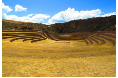
Inka-Terrassen von Moray

Nehmen Sie Abschied von Peru. Lassen Sie die letzten Tage bei einem gemütlichen Spaziergang durch den Park von Miraflores Revue passieren, ehe Sie mit vielen neuen Eindrücken im Gepäck Ihren Rückflug nach Deutschland antreten.