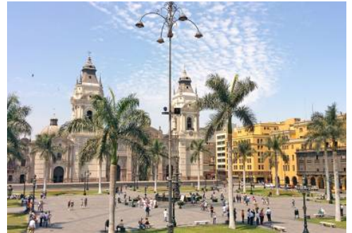
Plaza de Armas in Lima

Als wirtschaftliches und kulturelles Zentrum Perus begeistert die Metropole am Pazifik mit zahlreichen Sehenswürdigkeiten, die sich Ihnen bei Ihrer heutigen Sightseeing-Tour im schönsten Licht präsentieren. Schlendern Sie zwischen Plaza Mayor und Plaza San Martín durch das historische Zentrum der Stadt, das zum UNESCO-Weltkulturerbe zählt, und lassen Sie sich von der faszinierenden Architektur bezaubern. Zwischen Villen und dem prächtigen Stadtpalast erwartet Sie das pittoreske Kloster Santo Domingo, das mit seiner schönen Architektur, zahlreichen Mosaiken und einem idyllischen Garten begeistert. Anschließend erwartet Sie mit der Universität San Marcos die älteste Universität Südamerikas. Streifen Sie durch das historische Künstlerviertel Barranco, das mit einem einzigartigen Charme verzaubert, ehe Sie auf der hölzernen Puente de los Suspiros mit einem beeindruckenden Blick über das bunte Treiben belohnt werden. (F)