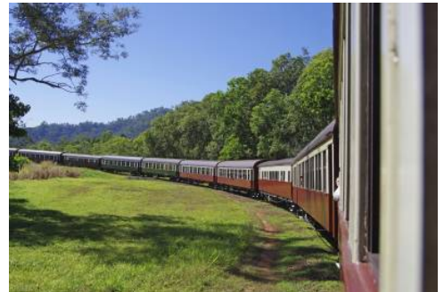
Zug nach Kuruanda

Früh am Morgen brechen Sie auf für Ihren Flug in den Westen Australiens in die charmante Stadt Perth. Am Abend treffen Sie dort ein und fahren direkt ins Hotel. (F)