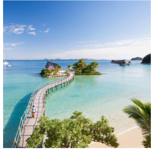
Likuliku Lagoon Resort

Beschreibung des Resorts: Das Likuliku Lagoon Resort liegt wie ein stilles Juwel in einer der schönsten Lagunen Fidschis, eingebettet in eine geschützte Bucht auf der Insel Malolo. Schon bei der Ankunft spürt man, dass dieser Ort etwas Besonderes ist: Das Wasser schimmert in allen Türkistönen, Palmen säumen die Strände und die Architektur fügt sich harmonisch in die Landschaft ein. Likuliku war das erste Resort in Fidschi mit Overwater-Bungalows – und bis heute gehört es zu den exklusivsten Adressen der Südsee.