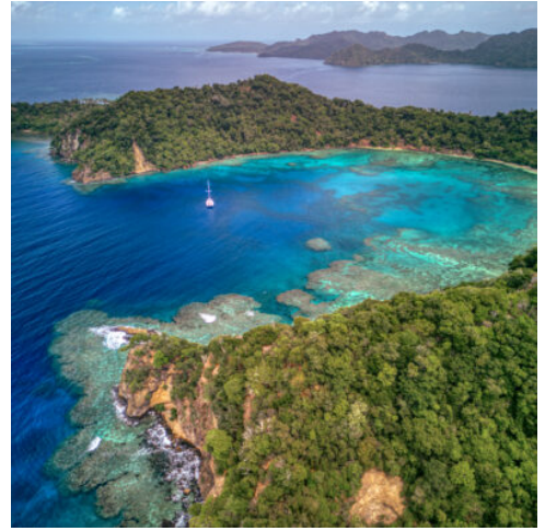
Matangi Private Island Resort

Beschreibung des Resorts: Matangi Private Island Resort – ein Ort, an dem man sofort ankommt und den Alltag hinter sich lässt. Die kleine Privatinself im Nordosten Fidschis ist von Regenwald, weißen Stränden und türkisblauem Meer umgeben und wirkt eher wie ein verborgenes Refugium als wie ein klassisches Hotel. Es gibt nur wenige Bungalows und drei außergewöhnliche Baumhäuser, die sich ruhig und harmonisch in die Natur einfügen – ohne Straßen, ohne Hektik, ohne Ablenkung.