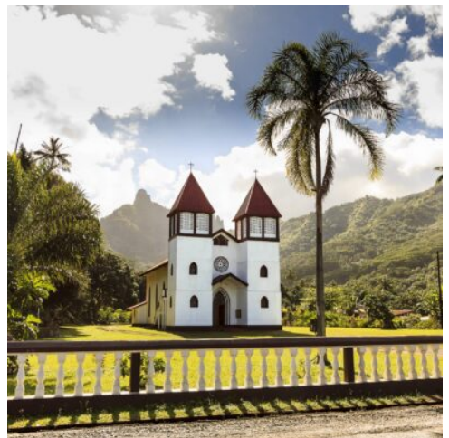
Kirche auf Moorea

Heute werden Sie von Ihrem Hotel zum Domestic Airport gebracht und fliegen weiter nach Huahine. Nach Ankunft werden Sie zu Ihrem Hotel gebracht. (F)