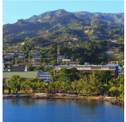
Papeete auf Tahiti

Fakarava wurde von der UNESCO zum Schutz seltener Arten als Biosphärenreservat eingestuft und ist das zweitgrößte Atoll in Französisch-Polynesien. Die Aranui wird am Pier „Rotoava“ anlegen. Sie haben Zeit, das kleine Dorf, die aus Korallen gebaute Kirche und das örtliche Kunsthandwerk zu entdecken. Genießen Sie einen Tag voller Entspannung, Sonne und Strand, Schwimmen oder Schnorcheln zwischen bunten tropischen Fischen. Für zertifizierte Taucher besteht die Möglichkeit zum Tauchen. Optionale Aktivitäten: Fahrradverleih, E-Bike, Quad, zertifiziertes Tauchen (Anmeldung an der Rezeption). (F M A)