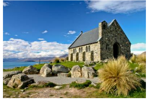
Church of the Good Shepherd, Lake Tekapo

Durch die sanfte Hügellandschaft geht es weiter in Richtung Küste. Am Strand der Moeraki Boulders erwartet Sie ein besonderer Anblick, denn der Strand ist von kugelförmigen Felsen geprägt. Anschließend geht es weiter in die schottisch anmutende Universitätsstadt Dunedin. (F)