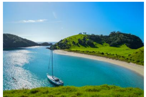
Bay of Islands

Heute heißt es Abschied nehmen. Lassen Sie Ihre Reise auf der Fahrt nach Auckland noch einmal Revue passieren, bevor Sie den Flughafen erreichen und mit zahlreichen neuen Erinnerungen im Gepäck Ihren Rückflug nach Deutschland antreten. (F)