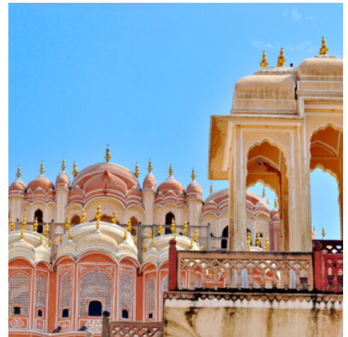
Jaipur - Jawa Mahal

Nach dem Frühstück im Hotel, treten Sie Ihre Reise nach Ranthambore an. Nach der Ankunft im Hotel checken Sie ein und können sich entspannen. Der Ranthambore-Nationalpark ist einer der größten Nationalparks in Nordindien und bekannt für seine majestätischen Indischen Tiger. Genießen Sie ein köstliches Mittagessen im Hotel und verbringen Sie den Rest des Tages damit, die natürliche Schönheit des Nationalparks zu erkunden. (F M A)