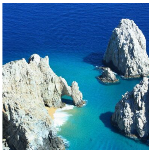
Cabo San Lucas

Heute fahren Sie nach El Triunfo, einem historischen Ort, der einst aufgrund seiner wertvollen Bodenschätze eines der wichtigsten Bevölkerungszentren der südlichen Baja California war. Schlendern Sie durch die charmanten, teilweise restaurierten Gassen des Städtchens und erleben Sie die geschichtsträchtige Atmosphäre, die von vergangener Glorie erzählt. Besuchen Sie das faszinierende Museo Ruta de Plata, das die Geschichte des Silberbergbaus und seine Bedeutung für die Region veranschaulicht, und das Museo del Vaquero de las Californias, wo Ihnen die Geschichte der Viehzucht und der Cowboy-Kultur in Kalifornien nähergebracht wird. Am Abend erreichen Sie Buena Vista, wo Sie ein Abschiedsessen genießen und den vorletzten Abend dieser unvergesslichen Reise in entspannter Atmosphäre ausklingen lassen können. (F A)