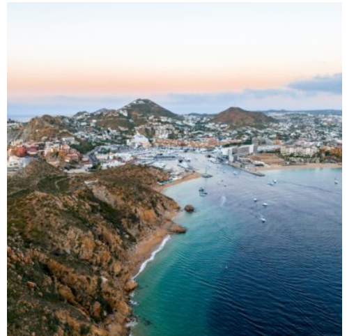
Cabo San Lucas

Nach dem Frühstück treffen Sie die restlichen Reiseteilnehmer in der Lobby des Hotels. Gestärkt beginnt der Tag mit einer Stadtbesichtigung von San José del Cabo, wo Sie die charmante Kolonialarchitektur und die künstlerische Atmosphäre des Ortes genießen. Besonders sehenswert sind die kleinen Straßen der Stadt, gesäumt von zahlreichen Geschäften mit Kunsthandwerk und Souvenirs, sowie der lebhaft Markt, der zum Stöbern und Entdecken einlädt. Anschließend geht es weiter nach Cabo San Lucas, wo Sie den berühmten Arch und die beeindruckende Küstenlandschaft bewundern können. Machen Sie einen Spaziergang am Yachthafen und genießen Sie das Meer und den wunderbaren Sandstrand am südlichsten Punkt der Baja California. Anschließend führt die Reise weiter über Todos Santos. Das Städtchen bietet heute eine Vielzahl von Geschäften, Restaurants und vor allem Galerien, die traditionelle Handwerkskunst und moderne Malerei anbieten. Am späten Nachmittag erreichen Sie schließlich La Paz, wo Sie den Abend entspannt ausklingen lassen und die Eindrücke des Tages in Ruhe Revue passieren lassen können. (F)