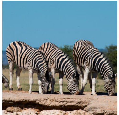
Zebras im Etosha Nationalpark

Am frühen Morgen landen Sie in Windhoek. Sie werden am Flughafen empfangen und starten direkt mit ihrer Rundreise nach Windhoek. Hier treffen Sie auf einen lokalen Guide, mit dem Sie einen traditionellen Markt in Katatura erkunden und lokale Spezialitäten probieren. Anschließend stoßen Sie in einem "Shebeen" zu afrikanischen Rhythmen mit einem kalten namibischen Bier an, bevor Sie Katatura verlassen und zu einer privat geführten "Craft-Brauerei" fahren. Hier haben Sie die Möglichkeit, dem Braumeister über die Schulter zu schauen und seine Produkte zu probieren. Nach der Verkostungstour verweilen Sie im Roof of Africa Restaurant und genießen dort ein hervorragendes Abendessen mit einem der gold-prämierten Biere. (A)