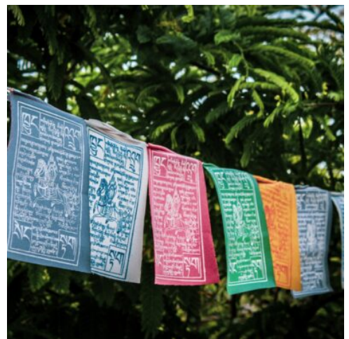
Gebetsfahnen, Sikkim, Indien

Nicht weit von der Stadt entfernt entführt Sie das buddhistisch-tibetische Kloster Zang Dhok Palri Phodang am heutigen Vormittag in die religiöse Tradition des Landes. Lassen Sie sich von den schönen Wandmalereien im Inneren der Gebetsräume bezaubern. Die nahe Tharpa Choling Gompa erinnert an den Orden der Gelupka, und die Wurzeln des nahegelegenen bhutanischen Klosters Thongsa reichen bis ins 17. Jahrhundert zurück. Nach diesen Impressionen führt Sie Ihre Reise in Richtung Nordosten in die buddhistische Pilgerstadt Gangtok. Die Hauptstadt von Sikkim begeistert mit ihrer schönen Lage auf einem Bergrücken, von wo sich wundervolle Ausblicke auf den Fluss Ranipool und den Gipfel des Bergs Kangchendzönga präsentieren. (F A)