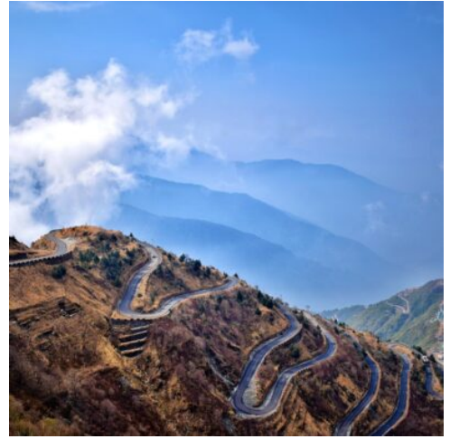
Zickzackstraße in Zuluk, Sikkim - Indien

Im Licht der Dämmerung fahren Sie hinauf auf den Tiger Hill. Aus 2.590 m Höhe bietet sich von hier ein spektakulärer Ausblick auf die schneebedeckten Gipfel des Himalayas. Werden Sie Zeuge, wie die aufgehende Sonne den gewaltigen Kangchendzönga und den fantastischen Mount Everest in der Ferne in rotgoldenes Licht taucht, und spüren Sie die einzigartige Atmosphäre dieser unvergleichlichen Naturlandschaft hautnah. Zurück in Ihrem Hotel genießen Sie ein gemütliches Frühstück. Bei einem Besuch in Darjeeling darf eine Fahrt mit einem der sogenannten Toy Trains der Darjeeling Himalayan Railway nicht fehlen. Der Schmalspur-Zug, der von der UNESCO zum Kulturerbe erklärt wurde, fährt noch immer mit der Original-Dampflokomotive. Ein Besuch des Ghoom-Klosters entführt Sie anschließend noch einmal in die religiösen Traditionen des Buddhismus. Prachtvolle Verzierungen und Malereien und zahlreiche Statuen machen es zum berühmtesten Kloster Darjeelings. (F A)