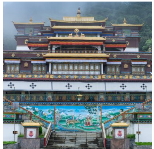
Ranka Kloster, Gangtok, Sikkim, Indien

Heute endet Ihre wundervolle Reise durch den Norden Indiens. Mit zahlreichen neuen Erinnerungen im Gepäck treten Sie Ihren Heimflug nach Deutschland an. (F)