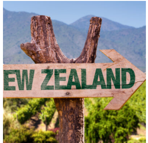
Willkommen in Neuseeland

Nach einem Umstieg in Singapur fliegen Sie weiter Richtung Christchurch.