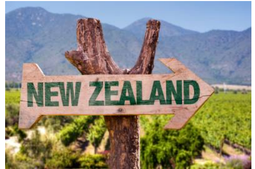
Willkommen in Neuseeland

Nach einem Umstieg in Singapur fliegen Sie weiter Richtung Christchurch.