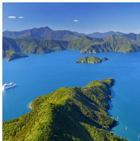
Cruise ship in Marlborough Sounds, New Zealand. Leaving Picton i

Erleben Sie auf Ihrem Weg die Bilderbuch-Seen Lake Wanaka und Lake Hawea, eingebettet in eine traumhafte Alpenkulisse. Faszinierend ist auch der Klima- und Vegetationswechsel, den Sie bei der Überquerung des Haast Passes beobachten können. Ziel ist der Westland Nationalpark wo sich der Fox- und der Franz-Josef-Gletscher bis hinab in die Küstenregion wälzen.