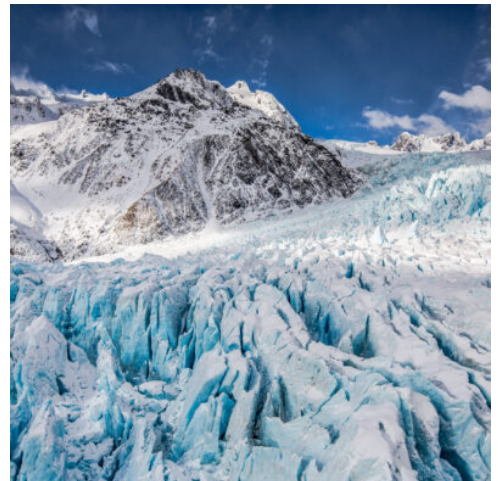
Franz Josef Gletscher

Am Morgen bietet ein Spaziergang um den Lake Matheson Gelegenheit unvergessliche Erinnerungsfotos zu schießen. Die Wanderung zu einem Aussichtspunkt am Franz Josef-Gletscher gewährt einen Blick auf die höchsten Berge der Südalpen und auf den Franz Josef-Gletscher. In Hokitika angekommen, erkunden Sie selbst mit E-Bikes die Seen und die Regenwälder rings um den Lake Mahinapoua. Schlendern Sie im Anschluss noch etwas durch die Stadt und erleben Sie den wunderschönen Sonnenuntergang direkt am Meer. (F)