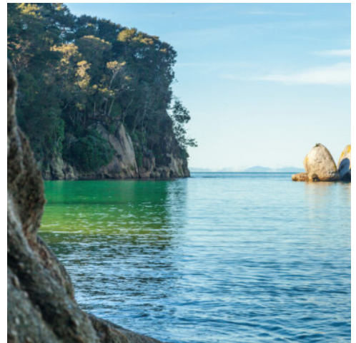
Abel Tasman National Park

Sie verlassen heute die Nordinsel Neuseelands. Die Fähre verlässt Wellington und eine rund dreistündige Schiffsfahrt beginnt. Entspannen Sie an Bord und halten Sie Ausschau nach Delfinschwärmen, die oft das Fährschiff begleiten. Bei der Einfahrt in die Marlborough Sounds können Sie die atemberaubende Einsamkeit der Fjordlandschaft genießen, bevor Sie im charmanten Hafentädtchen Picton wieder an Land gehen. Die Reise führt über Havelock in die sonnenverwöhnte Tasman Bay und schließlich nach Nelson. (F)