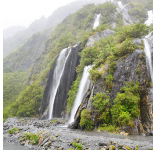
Franz Josef Wasserfall

Heute erleben Sie eine beeindruckende Fahrt durch die Schlucht des Buller River zur Westküste. Am Cape Foulwind erwartet Sie ein Spaziergang zu einer großen Robbenkolonie. Von hier aus geht es weiter entlang der wilden West Coast in Richtung Süden. In Punakaiki hat die tosende Brandung der Tasmanischen See die berühmten Pancake Rocks aus Kalkstein geformt. Diese Steilfelsen sehen aus wie riesige gestapelte Pfannkuchen und können einen mit spritzigen Wasserfontänen überraschen, wenn man nicht aufpasst. (F A)