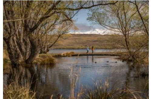
Tekapo - Lake Alexandrina

Sie folgen der Westküste weiter nordwärts bis nach Hokitika, einem gemütlichen Städtchen direkt am Meer. Wir empfehlen Ihnen an einer „Arahura Greenstone Tour“ teilzunehmen (buchbar vor Ort).