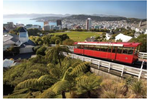
Wellington - Kelburne Hill

Dieser Tag gehört ganz Ihnen. Unternehmen Sie einen kleinen Spaziergang durch die Stadt oder entlang des Seeufers.