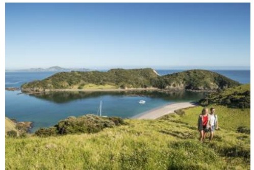
Bay Of Islands

Der heutige Tag steht Ihnen zur freien Verfügung. Der Abel Tasman Nationalpark bietet eine Vielzahl an Aktivitäten, besonders Wanderungen und Kajaktouren in jeder Länge und für jeden Fitnessgrad (buchbar vor Ort).