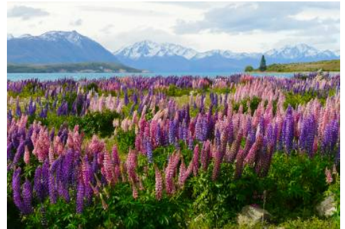
Mt. Cook Region Lupinen

Nach einem Umsteigeaufenthalt geht es weiter nach Christchurch.