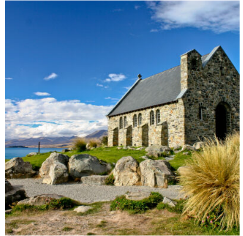
Church of the Good Shepherd

Über Murchison fahren Sie zunächst durch die eindrucksvolle Schlucht des Buller River zur Westküste. Am Cape Foulwind führt ein Spaziergang zu einer großen Robbenkolonie. Mit Fernglas kann man die Tiere hier ganz nah sehen. Von nun an folgt die Route der wilden West Coast nach Süden. Die tosende Brandung der Tasmanischen See hat im Paparoa National Park die berühmten Pancake Rocks in Punakaiki aus dem Kalkstein geätzt: Steilfelsen, die wie riesige gestapelte Pfannkuchen anmuten – und mit spritzigen Wasserfontänen pitschnass machen, wenn man nicht aufpasst. Sie übernachten in Greymouth, der größten West Coast Town. (F)