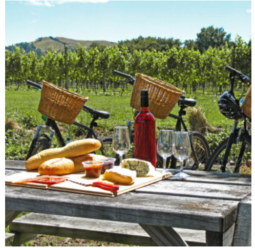
Fahrradtour auf dem Twin Coast Cycle Trail

Am Vormittag kreuzen Sie an Bord eines Ausflugsschiffs durch das bezaubernde Insellabyrinth der Bay of Islands. Hier nahm im 19. Jahrhundert die koloniale Erschließung des Landes ihren Anfang: ein abenteuerliches Stück Historie, das vielerorts Spuren hinterlassen hat. Am Cape Brett zieht ein felsiges Eiland mit dem berühmten "Hole in the Rock" alle Blicke auf sich. Halten Sie dennoch Ausschau nach Delfinen. Selbst Schwertwale (Orcas) tauchen hier manchmal auf. Dann legt das Boot an der Urupukapuka Insel an: spazieren Sie an der weissandigen Otehei Bay oder auf einen naheliegenden Hügel mit einem fantastischen Rundblick auf die Bay of Islands. Anschließend Fahrt von der Bay of Islands über Whangarei zurück nach Auckland. (F)