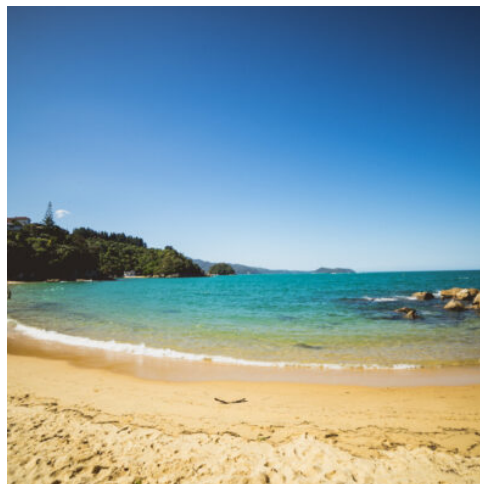
Abel Tasman Nationalpark

Die rund dreistündige Schifffahrt über das offene Meer der Cook Strait und durch die romantischen Marlborough Sounds führt Sie zur Südinsel Neuseelands in die Provinz Marlborough, dem größten Weinanbaugebiet des Landes. Das heutige Tagesziel ist die „Künstlerstadt“ Nelson, an der sonnenreichen Tasman Bay.