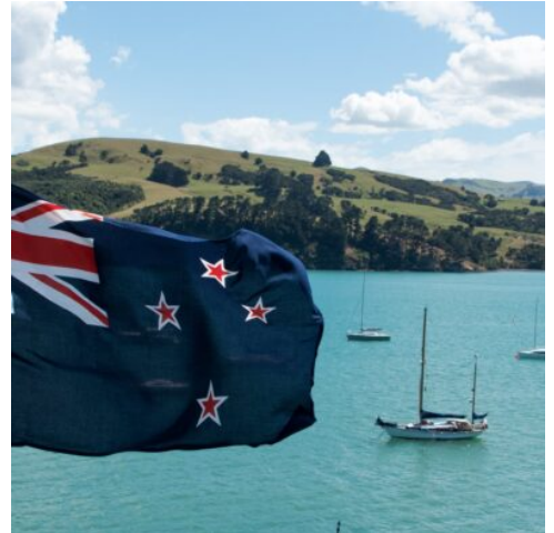
Flagge von Neuseeland

Herzlich willkommen in Neuseeland! Nach Ihrer Ankunft nehmen Sie einen Shuttletransfer, welcher Sie zu Ihrer ersten Unterkunft bringt. Am Abend treffen Sie auf Ihre Mitreisenden und Ihren Reiseleiter und beschließen den Tag bei einem gemeinsamen Abendessen. (A)