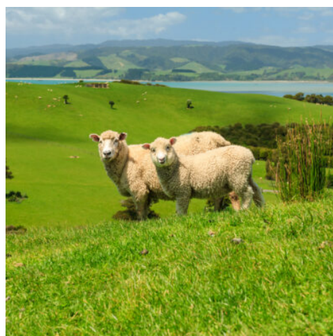
Landschaft in Neuseeland

Erkunden Sie die Hauptstadt Neuseelands heute auf eigene Faust. Im Stadtzentrum befinden sich zahlreiche Geschäfte, Cafés und Restaurants. Weitere Höhepunkte sind das Te Papa Tongarewa Nationalmuseum, der Botanische Garten und Oriental Bay. (F)