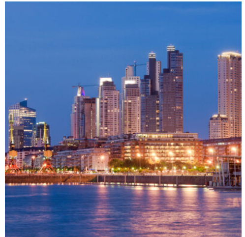
Puerto Madero bei Nacht, Buenos Aires, Argentinien

Bei Ihrer Landung in der lebhaften Metropole Buenos Aires werden Sie bereits von Ihrer Reiseleitung erwartet und zu Ihrem Hotel gefahren. Ruhen Sie sich ein wenig aus, ehe Sie am Nachmittag zu einer ersten Stadtbesichtigung durch die Geburtsstadt des Tangos aufbrechen. Spanischer Jugendstil und klassizistische Architektur aus dem 19. Jahrhundert prägen die von Ahornbäumen gesäumte Prachtstraße Avenida de Mayo, die mit ihrem französischen Flair, zahlreichen Cafés und Geschäften bezaubert. Anschließend lockt das historische Hafenviertel Puerto Madero mit traditionellen Backsteingebäuden und stilvollen Steakrestaurants. Genießen Sie das Treiben auf den Straßen, während Sie Ihre Fahrt in den stilvollen Stadtteil Palermo mit seinen schönen Stadtgärten und exklusiven Boutiquen fortsetzen. Ihr letztes Tagesziel ist der historische Friedhof La Recoleta. Prächtige Mausoleen, Statuen und Grabmale nach französischem Vorbild erinnern an die wohlhabenden Adelshäuser, die hier ihre letzte Ruhe fanden. Die berühmteste unter Ihnen ist hochverehrte Primera Dama Argentiniens Eva Perón, besser bekannt als Evita.