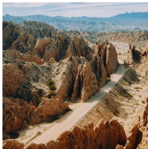
Quebrada de la Flechas, Argentinien

Gestalten Sie den Tag frei nach Ihren Wünschen. Lehnen Sie sich in einem der zahlreichen Straßencafés zurück, sehen Sie den Tango-Tänzern auf den Straßen zu und genießen Sie die Musik, erkunden Sie die Museen und Kirchen der Stadt oder tauchen Sie in das pulsierende Nachtleben von Buenos Aires ein. (F)