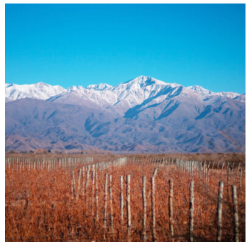
Valle de Uco, Argentinien

Von Buenos Aires aus fliegen Sie heute in den Südwesten Argentiniens, wo Sie am Fuße der Anden die Stadt Mendoza erwartet. Zahlreiche Winzereien, Weinhänge und Kellereien prägen die Region, die für Ihre exquisiten Rotweine bekannt ist. Weitläufige Alleen und Art-déco-Architektur prägen die Stadt, die mit ihren kleinen Geschäften und zahlreichen Parks zu Spaziergängen einlädt. Suchen Sie sich auf dem Plaza Independencia eine Bank im Schatten der Bäume und tauchen Sie in das entspannte Flair Mendozas ein. Etwas außerhalb der Stadt bietet der kleine Berg Cerro de la Gloria einen fantastischen Ausblick über die Dächer der Stadt. (F)