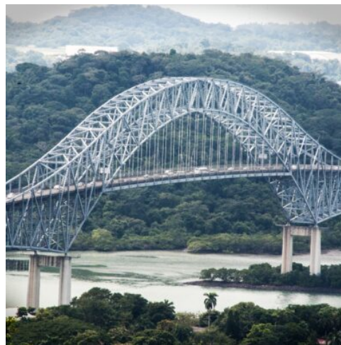
Puente de Americas

Heute überqueren Sie Panama vom Pazifik zur Atlantikküste. Nach dem Frühstück fahren Sie in die Provinz Colón, wo Sie das Agua Clara Besucherzentrum an den erweiterten Schleusen des Panamakanals erwartet. Hier erfahren Sie, wie riesige Frachtschiffe der Postpanamax-Klasse durch das moderne Schleusensystem geführt werden. Die Aussicht auf die riesigen Schleusenkammern und den Gatún-See ist beeindruckend. Im Anschluss geht es weiter zur Festung San Lorenzo, einem ehemaligen spanischen Militärhafen aus dem 16. Jahrhundert. Inmitten dichter Tropenvegetation erkunden Sie die gut erhaltenen Ruinen von Festungsmauern, Türmen und Lagerräumen, die einst als Stützpunkt für den transkontinentalen Handel dienten. Am Nachmittag kehren Sie zurück nach Panama City und besuchen die Ruinen von Panama Viejo, der ersten spanischen Siedlung an der Pazifikküste. Bei einem Rundgang durch das historische Gelände entdecken Sie die Überreste der Stadt, die 1671 von dem Piraten Sir Henry Morgan geplündert und zerstört wurde. (F M)