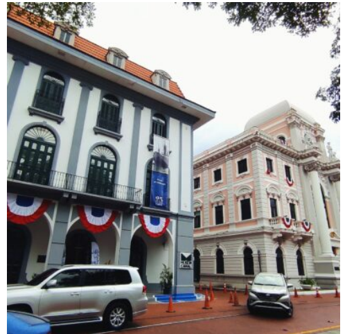
Panamá City - Casco Viejo

Heute entdecken Sie die spannende Hauptstadt Panamas. Am Morgen unternehmen Sie eine Wanderung im Parque Natural Metropolitano, einem tropischen Stadtwald mit reicher Pflanzenwelt und herrlichem Blick über Panama City. Anschließend fahren Sie zum Amador Causeway, einem künstlich angelegten Damm mit beeindruckendem Panorama auf die Bucht, die Puente de las Américas und die Skyline der Stadt. Am Nachmittag erkunden Sie die historische Altstadt Casco Viejo. Bei einem Rundgang erleben Sie die koloniale Architektur, lebendige Plätze und das kreative Flair dieses UNESCO-Weltkulturerbes. Ein Besuch des Fischmarkts bringt Sie mitten ins authentische Stadtleben. Probieren Sie frisches Ceviche und beobachten Sie das bunte Markttreiben. Danach entdecken Sie auf dem benachbarten Obst- und Gemüsemarkt exotische Früchte und kosten tropische Spezialitäten. Zum Abschluss genießen Sie eine Fahrt entlang der Cinta Costera oder durch das moderne Viertel Punta Pacifica mit Blick auf die eindrucksvolle Wolkenkratzerkulisse. (F)