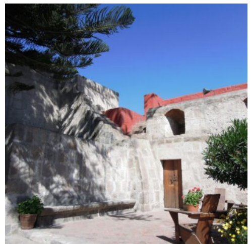
Santa Catalina Kloster in Arequipa

Am Morgen werden Sie zum Flughafen gebracht, von wo aus Sie Ihren Flug nach Arequipa antreten. Nach Ihrer Ankunft fahren Sie zu Ihrem Hotel. Am Nachmittag unternehmen Sie einen Stadtrundgang durch Arequipa. Einige der alten Gebäude wurden aus weißem Vulkangestein (Sillar) errichtet, weshalb ihr auch der Name die „Weiße Stadt“ gegeben wurde. Sie besichtigen das außergewöhnliche Kloster Santa Catalina. Das im 16. Jahrhundert erbaute Kloster ist ein riesiger Gebäudekomplex, der einst wie eine eigene Stadt war und über 450 Nonnen beheimatete. Früher wurden hier die ältesten Töchter der aristokratischen Familien schon in jungen Jahren der Kirche übergeben, wo diese dann ihr gesamtes Leben verbrachten. (F)