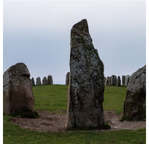
Die Steine von Ale

Sie fahren heute in die Metropole Göteborg, welche Sie auf einer 2-stündigen Stadtführung erleben. Schwedens zweitgrößte Stadt wurde 1621 von König Gustav II. Adolf gegründet und wuchs schnell zum Zentrum des kommerziellen Fischfangs und des Schiffbaus. Später spielte es eine führende Rolle in der innovativen Automobilindustrie, denn Göteborg ist die Heimat von Volvo. Sie sehen u.a. die bekannte Fischhalle, die Prachtstraße Avenyn und das gemütliche Künstlerviertel Haga. Im Zentrum finden Sie zahlreiche kleine befahrbare Kanäle und alte Bauwerke aus längst vergangener Zeit. Danach fahren Sie zu dem lieblichen Schloss Läckö, das bekannte Barockschloss des Grafen Magnus Gabriel de la Gardie am Ufer des Värsees. Danach fahren Sie zum Hotel in Örebro. (F)