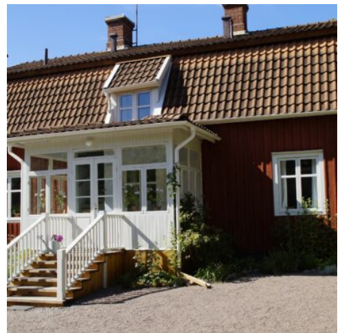
Geburtshaus von Astrid Lindgren

Heute erkunden Sie die Südküste Schwedens. Auf dem Weg nach Malmö machen Sie einen Halt in Mörrum am Laxenshus. Der nach dem Ort benannte Fluss mündet vier Kilometer südlich von Mörrum in die Pukavikbucht der Ostsee und ist einer der bekanntesten Lachsflüsse Schwedens. Weiter geht es über die schöne Küstenstadt Kivik und das Naturdenkmal „Die Steine von Ale“ nach Ystad. Am östlichen Ende der Einkaufsstraße wurde das Viertel Per Helsas gård mit seinen alten Fachwerkhäusern behutsam modernisiert. Hier liegen schöne Cafés und Geschäfte, die Kunsthandwerk verkaufen. Weiterfahrt zum Hotel nach Malmö am Öresund. (F)