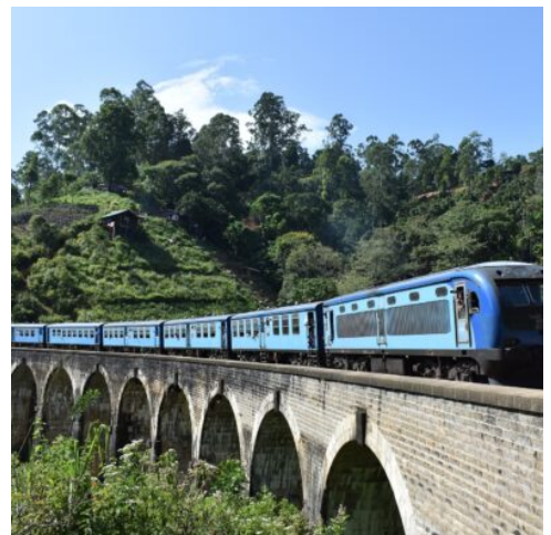
Zugfahrt nach Nuwara Eliya

Heute endet Ihre Reise durch Sri Lanka. Sie fliegen von Colombo wieder zurück in Ihre Heimat. (F)