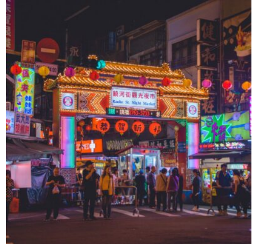
Der Raohe-Nachtmarkt in Taipeh

Der Gesang der Mönche füllt die Morgenluft und lädt dazu ein, an der morgendlichen Andacht teilzunehmen. Nach dem Frühstück fahren Sie weiter in die nahe Hafenstadt Kaohsiung. Zwischen den modernen Hochhausfassaden begrüßen Sie der schöne Frühlings- und der Herbstpavillon, die mit ihrer kunstvollen Architektur und ihrer idyllischen Lage im Lotussee bezaubern. Leuchtend bunt präsentieren sich die Tempel Kaohsiungs, allen voran die fantastische Drachen- und Tiger-Pagode, deren Mäuler als Eingang ins Innere der Pagode dienen. Nach diesen Impressionen erwartet Sie am Ufer des Flusses Chihpen ein ganz besonderes Erlebnis, denn heiße Quellen laden hier zum Erholen und Entspannen ein. (F)