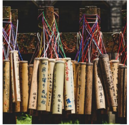
Gute Wünsche auf Bambus geschrieben

Die mächtige Taroko-Schlucht bildet das Herz des gleichnamigen Nationalparks, den Sie heute erkunden. Türkisgrün schimmert der Fluss, der über Jahrmillionen hinweg die Schlucht formte. Atemberaubende Berglandschaften, zerklüftete Felsen und die ursprüngliche Vegetation des Regenwaldes schaffen eine unvergleichliche Landschaft, Teiche, Wasserfälle und Bäche laden zum Verweilen ein. Grotten und Höhlen prägen das schroffe Gestein, ein besonderes Highlight ist der kunstvolle Schrein des ewigen Frühlings. Nutzen Sie die Zeit für gemütliche Spaziergänge durch die fantastische Natur, ehe Sie weiter nach Taipeh fahren. (F)