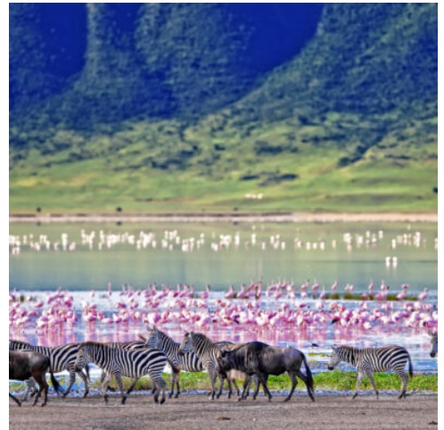
Ngorongoro Krater - Tierreichtum, Tansania

Die magische Silhouette des Kilimandscharo bildet die Kulisse für Ihre Landung in Tansania. Ihr erstes Ziel erwartet Sie mit am Lake Manyara, der von einem atemberaubenden Nationalpark umgeben ist. Zwischen Kilimandscharo und der berühmten Serengeti gelegen, begeistert der Park mit weiten Graslandschaften, ursprünglichen Sümpfen und grünem Wald, der sich um den beeindruckenden Süßwassersee Manyara ringt. Hunderte Vogelarten versammeln sich hier ebenso wie Elefanten, Giraffen und Flusspferde, die im kühlen Nass Erfrischung suchen, und mit etwas Glück erspähen Sie einen der zahlreichen Löwen, die in den ausladenden Astgabeln der Bäume den Schatten genießen und auf Beutetiere lauern. Ihre erste Nacht in Tansania verbringen Sie inmitten der Natur in einem wunderschönen Unterkunft. (A)