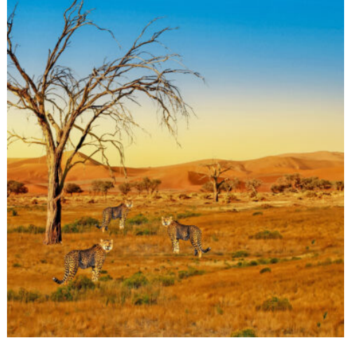
Geparden in Serengeti-Park, Tansania

Bis zu 600 m hoch erheben sich die Wände des Kraters und erschaffen eine natürliche Grenze zwischen dem Inneren des Kraters und der Außenwelt. Die heutige Safari gewährt Ihnen einen einzigartigen Einblick in die vielfältige Kraterwelt, in der Nashörner, Zebras, Elefanten, Gazellen und Antilopen, aber auch Löwen, Hyänen und Leoparden gemeinsam leben. Durch Heideland und Bergwälder begeben Sie sich auf eine abenteuerliche Pirschfahrt, die Ihnen sicher noch lange im Gedächtnis bleiben wird. (F M A)