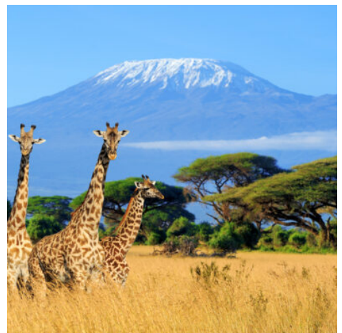
Giraffen vorm Kilimandscharo

Heute erwartet Sie der wohl berühmteste Nationalpark Afrikas: Der Serengeti Park, eine ewige Savanne, die bis in den Süden Kenias reicht. Bei einer ersten Jeepsafari erleben Sie die atemberaubende Tierwelt der Serengeti hautnah. Elefantenherden streifen durch die Steppe, Büffel, Zebras, Gnus und Antilopen sammeln sich an Flüssen und Wasserlöchern. Raubkatzen wie Geparden und Leoparden schlummern im Geäst der Akazien, in den Flüssen lauern Krokodile und Flusspferde auf Beute und mit etwas Glück können Sie Löwenrudel bei der Jagd beobachten. Im halbhohen Gras verbergen sich kleine Tiere, und von der Erde erhebt sich der Staub, wenn Elefanten vorüberziehen. Lassen Sie sich des Nachts von den Geräuschen der Wildnis in den Schlaf wiegen. (F M A)