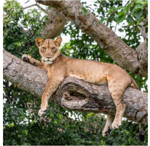
Löwe auf einem Baum

Der heutige Tag beginnt bereits sehr früh, um sich auf das bevorstehende Gorilla-Trekking (optional, siehe Wunschleistungen) vorzubereiten. Das Trekking der Berggorillas ist eine der aufregendsten Tierbegegnungen auf der Erde. Die Wanderung dauert zwischen 2 und 6 Stunden, ist aber die Anstrengung absolut wert. Sie werden von einem erfahrenen Ranger begleitet, der Ihnen interessante Fakten über Flora, Fauna und den Lebensstil der Gorillas erzählen wird. (F A)