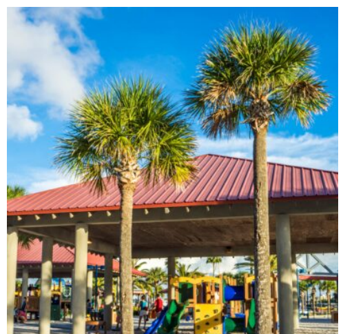
Clearwater Beach, Florida

Sie verlassen heute den Big Apple und fliegen weiter in den Süden in Florida. Das im Südosten der USA gelegene Florida mit seinen Küsten am Atlantischen Ozean und am Golf von Mexiko birgt viele Überraschungen: von Traumstränden zu sensationellen Naturdenkmälern, erstklassigen Kulturattraktionen und kaum bekannten Schätzen. Ihr erstes Ziel ist die Stadt Orlando, ein farbenfrohes Vergnügungsmekka aus Freizeit- und Themenparks. Hier werden Sie durch Ihre neue Reiseleitung begrüßt und es erfolgt der Transfer zu Ihrem Hotel. (F)