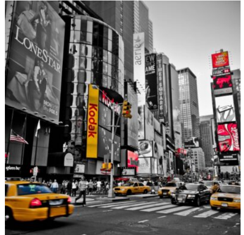
New York City

Am Morgen lernen Sie die Stadt, die niemals schläft, auf einer Stadtrundfahrt näher kennen und entdecken dabei die vielen Höhepunkte, die besonders der Stadtteil Manhattan zu bieten hat. Sie fahren zudem hinauf zur Aussichtsplattformen des Rockefeller Centers. Von hier genießen Sie fantastische Blicke auf das Empire State Building und den Central Park. Im Gegensatz zu anderen Plattformen versperrt keine Glasscheibe den Blick vom obersten Punkt auf Manhattan – ein fantastisches Erlebnis. (F)