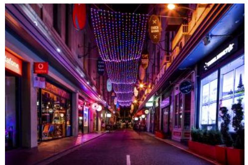
Melbourne - Graffiti

An der Ostküste Tasmaniens erkunden Sie heute die rauen Anfänge Australiens. In Port Arthur entstand damals ein grausames Häftlingslager, welches als Hölle auf Erden gefürchtet war. Heute zählt das Gelände mit über 30 Gebäuden zum UNESCO-Weltkulturerbe. Sie entdecken die düstere Vergangenheit bei einer Führung inklusive Hafenrundfahrt. Anschließend tauchen Sie in die faszinierende Natur der Insel ein. Rückkehr nach Hobart am späten Nachmittag.